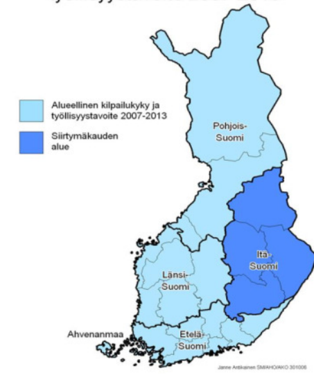
Alueellinen kilpailukyky ja työllisyystvoite 2007-2013

3. Horisontaaliset tavoitteet; yhteistyö ja kumppanuus, yritysten toiminta- ja kilpailuympäristön kehittäminen, tasa-arvo, eri ohjelmien (EAKR-ESR) yhteensovitus ja koordinaatio sekä kestävä kehitys